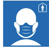
FFP 2 Maske tragen!